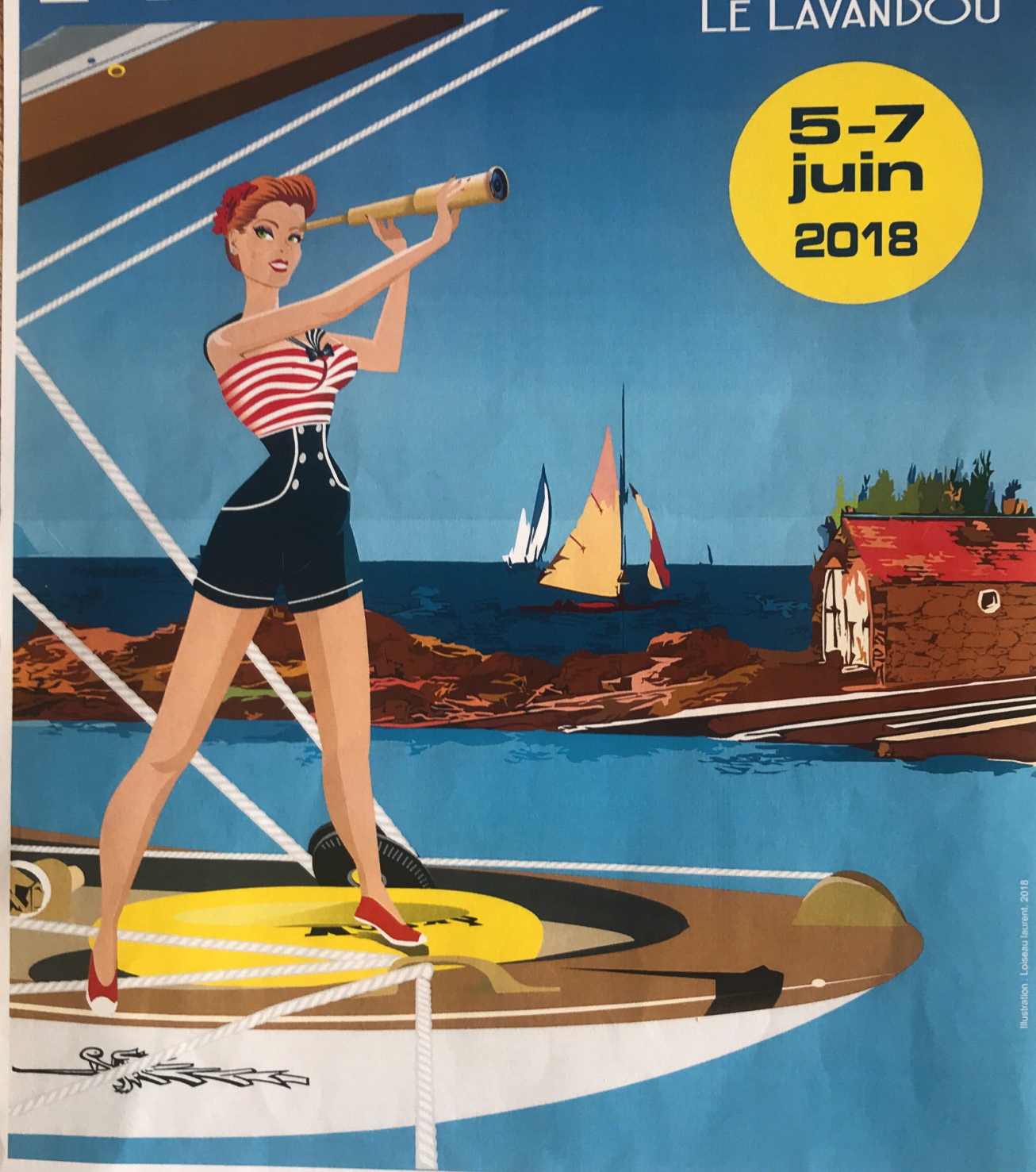
Illustration : Lobeau Laurent, 2018